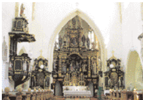
Kircheninneres mit Hoch- und Seitenaltären

1440). Den linken Seitenaltar (um 1700), hochbarock und ebenfalls schwarz-gold gefasst, ziert das Ölbild "Das letzte Abendmahl" aus der Veroneser Schule. Der rechte Seitenaltar ist ein Pendant zum linken und trägt das Ölbild "Triumph der Kirche in ihren Märtyrern", ebenfalls aus der Veroneser Schule.