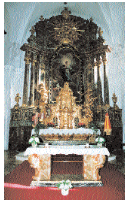
Der Altar der Wallfahrtskirche