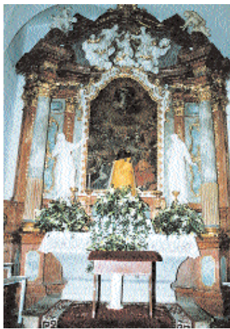
Der Allerheiligenaltar mit einer Kopie der "Schwarzen Muttergottes"

zweigeteilt. Vorne steht der Gnadenaltar mit Tabernakel und Leuchtern, hinten die sog. "Schwarze Kuchl" mit dem Gnadenbild. Die Madonna wirkt fast byzantinisch streng. An der schlanken Figur fallen die überlangen, feinen Hände auf. Das Jesuskind auf der ausgestreckten Hand trägt die Weltkugel, beide Figuren tragen eine Krone.