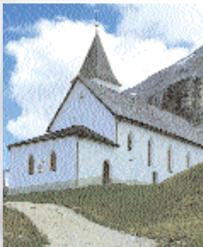
Außenansicht der Kirche

Geschichte: Der Sage nach wurde Heiligkreuz an jener Stelle erbaut, an der Graf Volkhold von Lurngau seine letzten Lebensjahre als Einsiedler verbracht haben soll. Es wird vermutet, dass zu Beginn auf dem Hügel nur ein Kreuz aus Holz stand und erst in späteren Jahren eine Kapelle errichtet wurde. Weibbischof Konrad von Brixen weihte laut Urkunde die Wallfahrtskirche zum Heiligen Kreuz am 18. Mai 1484 ein. Um 1665 wurde die spätgotische Kirche erweitert und umgebaut. Zu dieser Zeit ist auch der Turm des Gotteshauses errichtet worden. Unter Joseph II. kam es 1778 zur Aufhebung und Entweihung der beliebten Wallfahrtsstätte. Der Pilgerstrom blieb dennoch nicht aus. Im Jahre 1839 wurde endlich das lang ersehnte Dekret erlassen und am 15. Juni des darauf folgenden Jahres die verehrte Statue des kreuztragenden Christus nach 54 Jahren Abwesenheit von der Pfarrkirche St. Leonhard/Abtei zum Gnadenort zurückgetragen. Die durch Wettereinflüsse