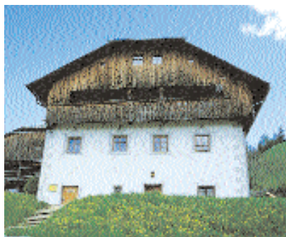
Geburtshaus von Josef Freinademetz

Die Wiege des selig gesprochenen Glaubenspioniers Josef Freinademetz (1852-1908) stand im kleinen Weiler Oies der Gemeinde Abtei in Südtirol, dem Gebiet der ladinischen Sprache in den Dolomiten, das damals staatlich wie kirchlich noch zu Österreich gehörte. Als junger Geistlicher der Diözese Brixen schloss er sich der neu gegründeten Gemeinschaft Arnold Janssens an und reiste 1879 nach China aus. Das hohe Ideal des engagierten Glaubensverbreiters führte zur Gründung der Steyler Missionsgenossenschaften. Freinademetz war der erste Missionar seiner Ordensgemeinschaft in diesem Land und wurde den Chinesen ein Chinese , um sie für Christus zu gewinnen. Mit einer kleinen Station und nur 158 Christen begann er seine Arbeit 1882. Bei sei-