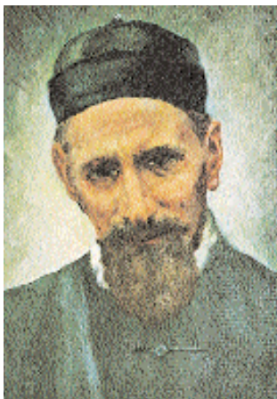
Der selige Josef Freinademetz

nem Tode im Jahr 1908 zählte Südshantung bereits 45.000 Getaufte und ebenso viele Taufbewerber. In 1.100 Gemeinden waren Kirchen, Kapellen und Gebetslokale errichtet worden. Warum und wann man begann, den charismatischen Geistlichen um Fürsprache zu bitten, ist nicht mehr zu klären. Bereits in den 30er Jahren wurde an der Pfarrkirche St. Leonhard in Abtei eine Gedenktafel an den verstorbenen Missionar angebracht. In den dreißiger Jahren begann der Prozess für die Seligsprechung von Freinademetz, der zuerst in den Jahren 1936-38 in der Diözese Yenchowfu geführt wurde, wo er gestorben war, später auch als Nebenprozess 1937 im Gadertal. 1939 erschien in deutscher und italienischer Sprache die Volksbiographie des Chinamissionars, die starke Verbreitung fand. Da sein Grab im kommunistischen China nicht nur unerreichbar, sondern, wie später bekannt wurde, völlig zerstört worden war, wurde sein Geburtshaus in Oies/Abtei bald zum wichtigsten Zentrum seiner Verehrung. In den 60er Jahren übernahm die SVD das im Wesentlichen unverändert gebliebene Gebäude. Es wurde zu einem bewusst einfach gehaltenen Ort der Besinnung und des Gebetes,