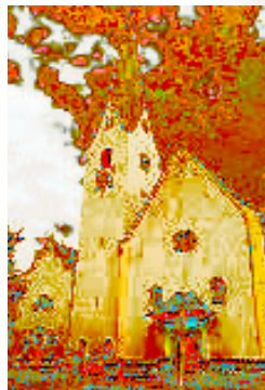
Außenansicht der Kirche

Innenraum: Das Langhaus ist dreijochig und zeigt eine Doppelpilastergliederung, ein gemeinsames Sockelband und Gebälkstücke sowie ein umlaufendes Gesims, das über den Doppelpilastern verkröpft ist. In den Stichkappen befinden sich Kreisfenster. Der eingezogene Triumphbogen ruht auf Wandpfeilern. Der Chor ist zweijochig und ruht auf Kompositpilastern. Ihn krönt ein Stichkappentonnengewölbe. Im Chorraum links befinden sich anstelle der rundbogigen Fenster kleine Durchblicke in die angeschlossene Sakristei. Die Fensterlaibungen und Fensterumrahmungen sind mit Stuckleisten und Kartuschenrollwerk verziert. Dieser Schmuck entstand um 1685/90. Die Doppelpore im Westen der Kirche weist drei Achsen auf, unterhalb befindet sich ein flachgedrückter Bogen auf zwei Pfeilern mit einem Kreuzgratgewölbe. Das Deckengemälde im Presbyterium, die „Übergabe der Schlüssel an Petrus“, ist das einzige Bild, das der große Künstler J.-J. Zeidler in seiner Heimatgemeinde gemalt hat. Der Hochaltar ist ein schwerer Sechssäulenaufbau mit einer hohen Tabernakelzone, gerade abschließendem Gebälk und gesprengten Giebelstücken. Das Deckenfresko im Mittelschiff wurde vom akad. Kunstmaler Wolfram Köberl, Innsbruck, geschaffen und 1975 vollendet. Bemerkenswert ist die neue Orgel von der Orgelbaufirma „Verschueren“, NL, aus dem Jahre 2000. Das Orgelgehäuse von 1786 zählt zu den schönsten Österreichs.