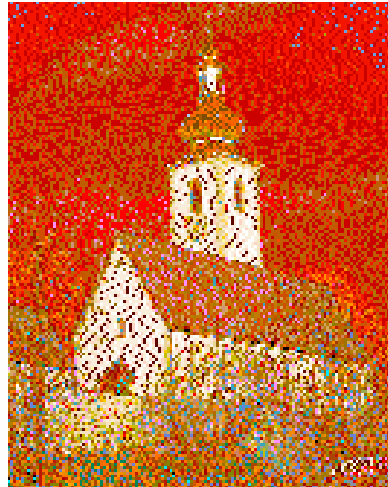
Die Pfarrkirche von St. Margarethen

Innenraum: Das 4-jochige Schiff hat Wandpilaster und eine Spitzkappentonne. Der Chor ist mit Fenstersims