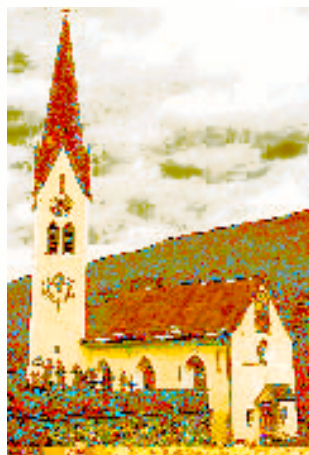
Außenansicht der Wallfahrtskirche